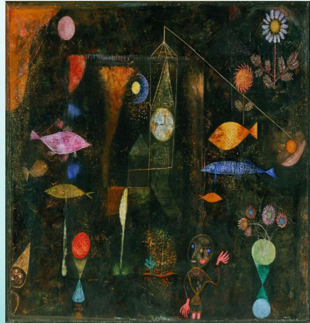
Fish magic, 1925*