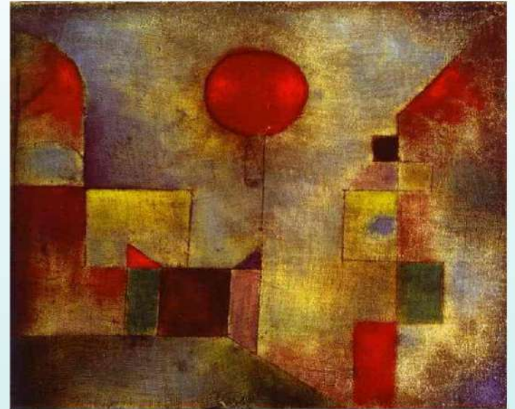
Red Balloon, 1922*

*οι πίνακες ανήκουν στο ζωγράφο Paul Klee (18 Δεκεμβρίου 1879-29 Ιουνίου 1940), που απεβίωσε από σκληρόδερμα. Εξατίας του η 29η Ιουνίου έχει καθιερωθεί ως η παγκόσμια μέρα σκληρόδερμος.