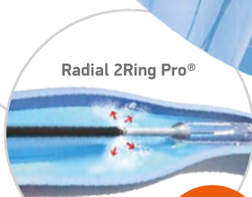
Radial 2Ring Pro®